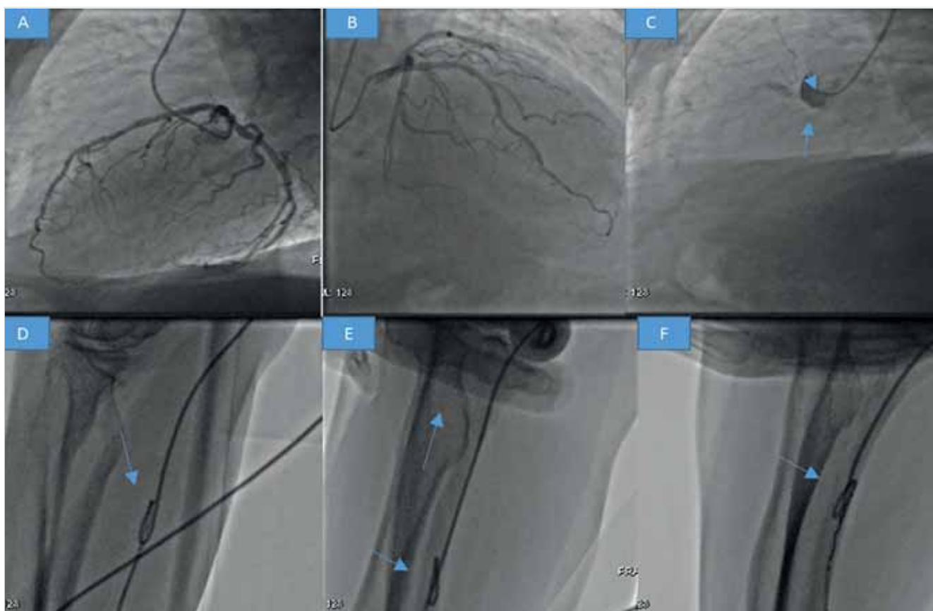
1. ÁBRA. Panel A: bal koronáriarendszer angiográfia laterális nézet. Szignifikáns szűkület nem ábrázolódik. Panel B: bal koronáriarendszer angiográfia, RAO 20, CRA 40 nézet. Szignifikáns szűkület nem ábrázolódik. Panel C: jobb koronária szelektív angiográfia sikertelen (nyíl). Panel D: a sérült diagnosztikus 5F JR4 katéter eltávolítási kísérlete, de spazmus, helyhiány miatt elakadás áll fenn (nyílak). Panel E: a csontos alaphoz történik a katéter disztális részének szorítása, de a csomó nem oldódik (nyílak). Panel F: intervencióhoz használt vezetődrotok alkalmazása a megtörtetés kiegyenesítésére (BHW, Whisper ES) sikertelen (nyíl)

A 76 éves férfi beteg anamnézisében hipertónia, 2-es típusú diabetes mellitus, obesitas szerepeltek. Effort angina és dyspnoe miatt indult kivizsgálása. Elektrokardiogram (EKG) regisztrátumon sinusritmust észleltünk normofrekvenciával és balkamra-hipertrófiára jellemző képet. Klinikai echokardiográfias vizsgálattal tágabb pitvarok, normális tágasságú bal és jobb kamra, jó bal- és jobbkamra-funkció igazolódott regionális falmozgászavar nélkül. A meszes aortastenosis vizsgálata 107 Hgmm-es csúcs-, 60 Hgmm-es átlaggrádienszt igazolt, a számított billentyűfelszín 0,9 cm 2 -nek adódott. Ezt követően koronarográfiát indikáltunk. A szívkatéterezést a klinikánkon rutinszerűen jobb arteria radialis behatolásból végeztük 5F hüvelyen keresztül. Az eseménymentes szűrást és felhatolást követően megtörtént a bal koronáriarendszer angiográfias vizsgálata 5F diagnosztikus JL4 katéterrel (Terumo, Japán), amely nem szignifikáns elülső leszálló ág (LAD) szűkületet igazolt (1. ábra, panel A, B). Ezt követően a JR4 (Terumo, Japan) diagnosztikus katéterrel az aorta ascendensben történt