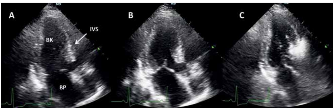
3. ÁBRA. A képen jól látható a septalis túlsúlyal jelentkező hipertrófia (A-panel). Az echokardiográfias kontrasztanyag beadását követően a septalis artéria ellátási területe jól azonosítható, az echo kontrasztanyag a septum basalis és középső részére lokalizálódik, amely alapján a PTSMA elvégezhető (B- és C-panel). BK: bal kamra, BP: bal pitvar, IVS: intraventricularis septum

Sikeres PTSMA során a LVOT-gradiens már közvetlenül a beavatkozást követően szignifikáns mértékben csökken, amely remodelling következtében 6-12 hónap múlva éri el végleges mértékét (16–19). A bal kamrai re-