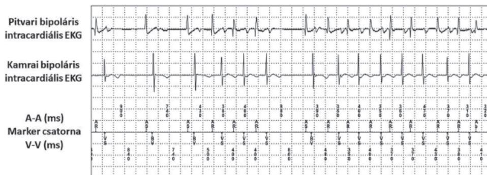
2. ÁBRA. A pacemaker lekérdezésekor regisztrált intrakardiális EKG-k (AS- és AR-markerek pitvari érzékelést jelölnek; VS-marker esetén kamrai érzékelés, BV-marker esetén biventrikuláris ingerlés történik)