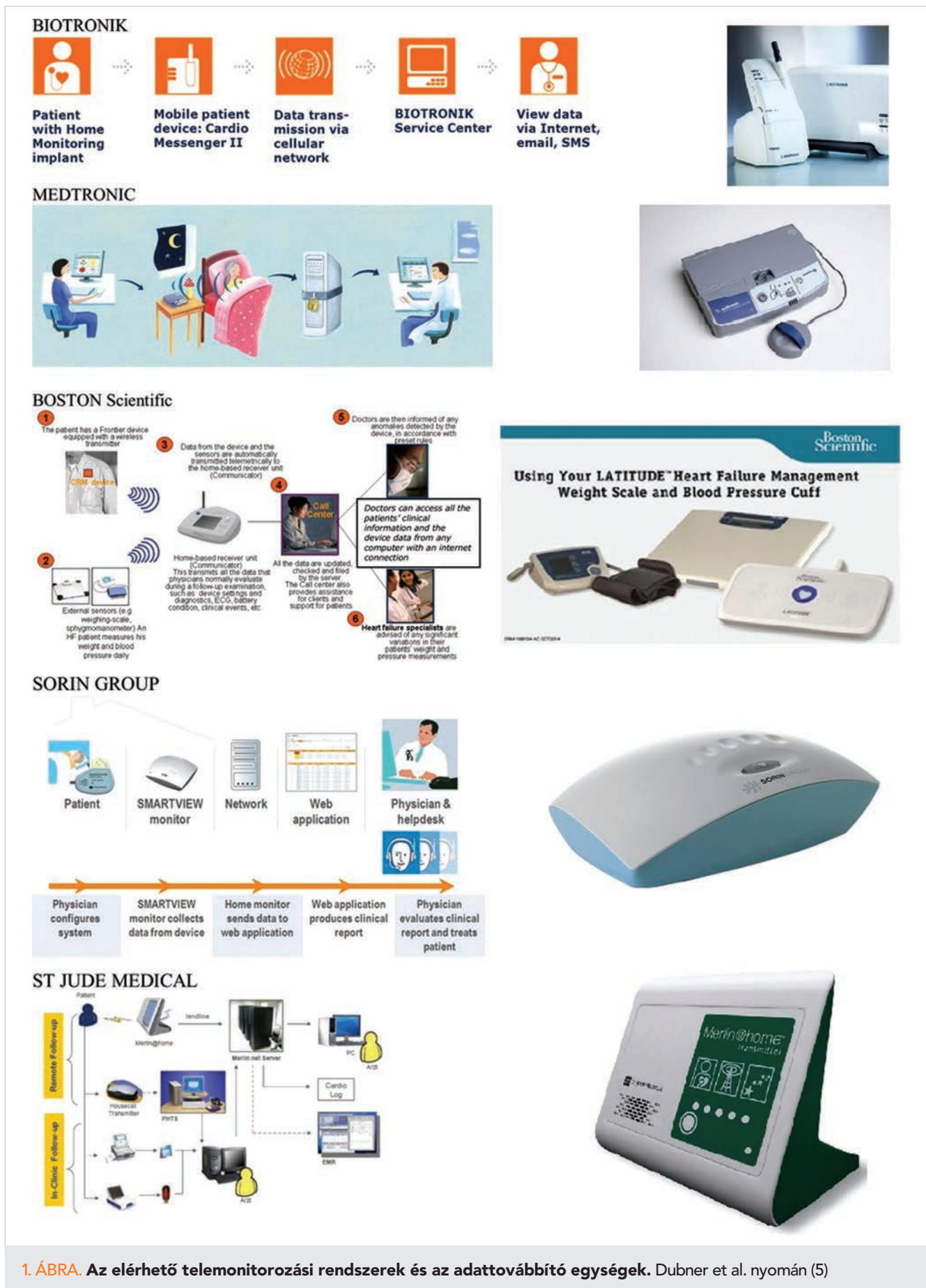
1. ÁBRA. Az elérhető telemonitorozási rendszerek és az adattovábbító egységek. Dubner et al. nyomán (5)