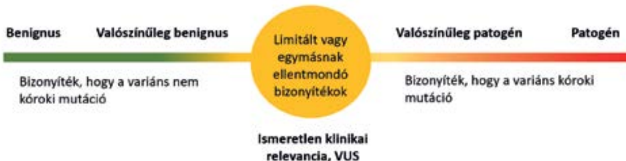
1. ÁBRA. A variánsok osztályozása patogenitási spektrum mentén (Semsarian és munkatársai JACC, 2021 alapján)