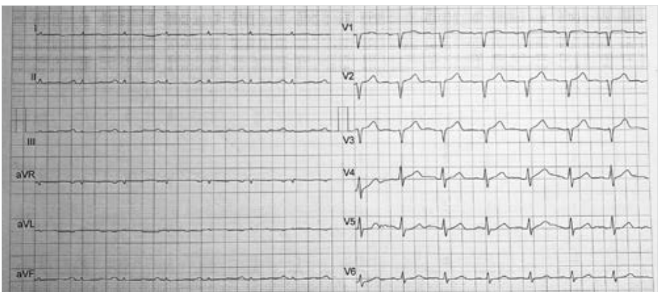
2. ÁBRA. AL-szívamyloidosisos beteg EKG-ja. Alacsony végtagi kilengések, R-redukció. A beteg szívultrahangon mért bal kamrai szeptum vastagsága 17 mm volt

a diagnosztikus éberség növelése a célunk hazánkban. Vizsgálatunk másik célja az volt, hogy vizsgáljuk, a különböző eredetű szívamyloidosis esetén van-e különbség a low voltage, R-redukció, illetve bal kamrai falvastagodás gyakoriságában. Az EKG-jelek tekintetében nem találtunk különbséget (2. ábra), amelyet akkor sem tudtunk igazolni, ha az AL-csoportot az ATTR-csoporttal hasonlítottuk össze. Ezzel szemben 9 beteg, akinek az átlagos bal kamrai falvastagsága nem érte el a 12 mm-t, mind az AL-csoportból került ki, miközben biomarker-szintjük is szignifikánsan magasabb volt, mint az ATTR-csoportnak. Azt, hogy az AL- és ATTR-csoportban szignifikánsan különbözik a bal kamrai átlagos falvastagság grafikusán is ábrázoltuk (3. ábra). Minden bizonnyal csak a kisebb esetszám az oka, hogy a szignifikanciát elérő különbség csak AL vs. ATTR esetén mutatkozott meg, a három csoport összehasonlításakor nem. A különbség háttérben két tényező állhat. Egyrészt az