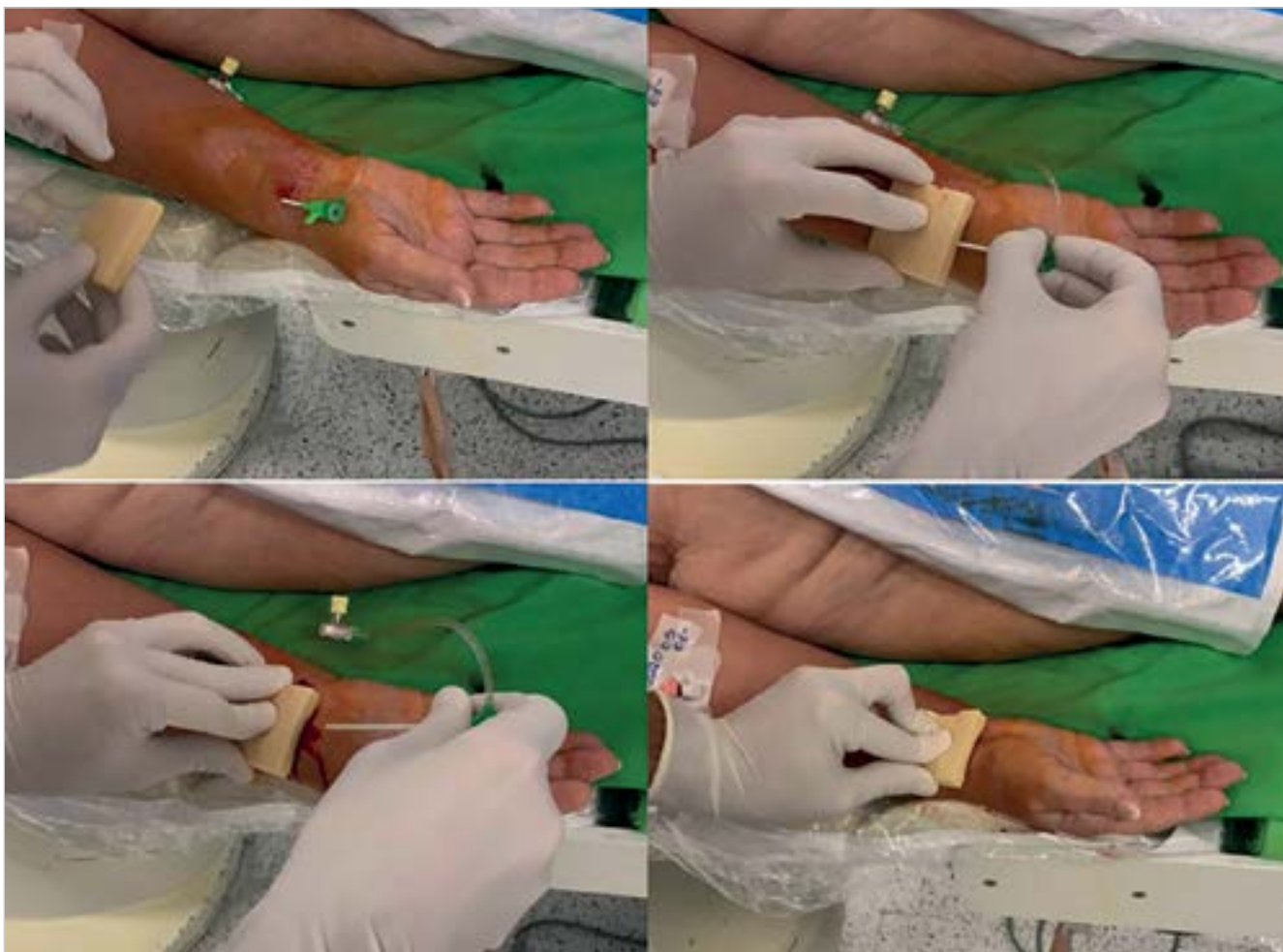
2. ÁBRA. Kitozán bevonatú vérzészillapító eszköz felhelyezésének folyamata. A sheath eltávolítását követően egy percig az eszközzel végzünk manuális kompressziót, majd nyomókötés kerül a betegre. A kötést fokozatos lazítás mellett egy-másfél órával később az eszközzel együtt eltávolítjuk. Ezt követően fedőkötést helyezünk fel, amely másnap eltávolítható

nifikáns különbség a RAO tekintetében az artériaspasmus klinikai jelenléte ( OR=3,53 ; 95% CI: 1,87–6,66; p<0,001 ), valamint a több mint egy punkció esetében volt ( OR=2,58 ; 95% CI: 1,43–4,66; p=0,002 ). A spasmus a katétermanipuláció így a beavatkozás hossza valamint a beteg komfortja szempontjából klinikailag is releváns szempont. A beavatkozás elején adott nitroglicerint segítségével a katéter és az artériafal találkozása következtében fellépő sérülések jelentősebb része elkerülhető, azonban az artériafal sheath-tel érintkező szakaszára nincsen hatással és itt a leggyakoribb az endothelsérülés a beavatkozás után, még hidrophil bevonatú sheath-ek alkalmazása esetén is. A vizsgálat értékét csökkenti, hogy a RAO-események abszolút száma a vártnál kevesebb volt, amely az elemszám becslésének helyességét befolyásolhatja (29). Ugyanezen vizsgálat frissen publikált, előre meghatározott alcsoport analízisében a nitrát az összes operatőr esetében és a tapasztalt (> 1000 TRA), illetve közepesen tapasztalt (100-1000 TRA) operatőrök alcsoportjaiban sem csökkentette a radiális artériában kialakuló spasmus előfordulását (17,4% vs. 11,1%, p = 0,04 ), egyedül a tapasztalt