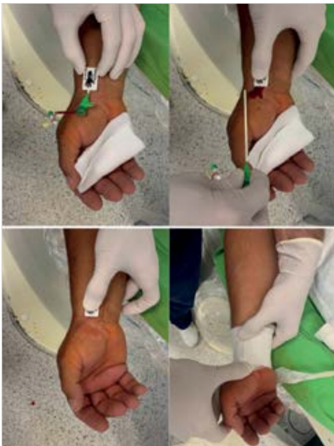
3. ÁBRA. Kálium-ferrát bevonatú vérzéscsillapító eszköz felhelyezésének folyamata. A sheath eltávolítását követően egy percig az eszközzel végünk manuális kompressziót, majd nyomókötés kerül a betegre. A kötést fokozatos lazítás mellett egy-másfél órával később eltávolítjuk. A betegen hagyott eszközre fedőkötést helyezünk fel, amely az eszközzel együtt másnap eltávolítható

latlan operatőrök (< 100 TRA) esetében volt különbség, amely csoportban nagyobb számban fordul elő radiális spazmus. A tapasztaltabb, nagy esetszámmal rendelkező centrumokban dolgozó operatőrök esetében heparin mellett nitrát alkalmazása így az eddigiekben randomizált vizsgálattal igazolt előnyökkel nem jár (30). A verapamil esetében a VITRIOL-t, egy jelentős hazai vizsgálatot publikáltak. Egy vizsgáló által kezdeményezett, randomizált, kettős vak klinikai vizsgálatban a sikeres sheath-behelyezést követően 5 mg verapamil (297 beteg) vagy placebo (294 beteg) beadása történt. Másodlagos végpontok a verapamilhasználat, procedúra és fluoroszkópiás idő, kontrasztvolumen, szubjektív fájdalom, kódtörés (oldalkonverzió, vagy nem tervezett verapamilhasználat) voltak. A behatolási kapu konverzióban nem volt különbség a két csoport esetében (1,7% placebo és 0,7% verapamil esetében p=0,28 ), a kódtörés mértéke között sem találtak szignifikáns különbséget (3,4% és 1,3%; p=0,11 ). A beavatkozás idejében, a fluoroszkópiás időben, a kontrasztvolumenben, valamint a fájdalom szintjében a két csoport eredményei összehasonlíthatóak voltak. Hizoh és társai azt a